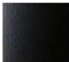
NERO RAL 9005 RAGGRINZANTE