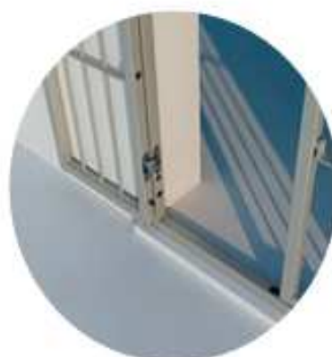
APERTURA TOTALE ESTERNA

I telai perimetrali della grata Libera sono disponibili in 4 diverse tipologie. Viene prodotta a 1 ante, a 2 ante, a 3 ante, a 4 ante, nella versione apribile a battente e fissa. È disponibile in 37 moduli ornamentali di serie. A richiesta è possibile realizzare i moduli ornamentali a disegno.