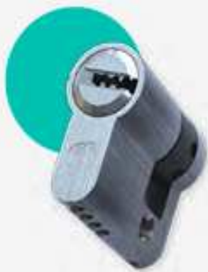
CILINDRO DI SICUREZZA K2