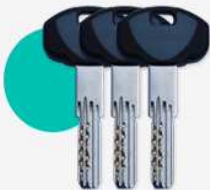
3 CHIAVI PADRONALI