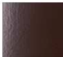
MARRONE RAL 8017 RAGGRINZANTE