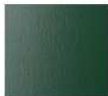
VERDE RAL 6109 RAGGRINZANTE