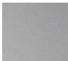
GRIGIO 400 SABLE