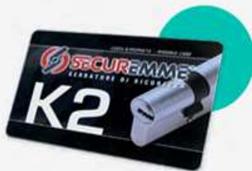
TESSERINA DUPLICAZIONE CHIAVI