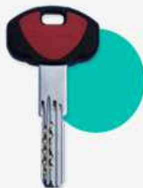
CHIAVE DI CANTIERE