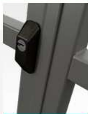
DEFENDER ESTERNO PER CILINDRO PASSANTE