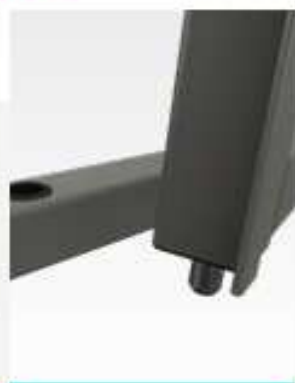
DOPPIO PUNTALE CHIUSURA SUPERIORE / INFERIORE