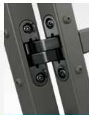
CERNIERE A SCOMPARSA IN ACCIAIO MICROFUSIONE INATTACCABILI DALL'ESTERNO