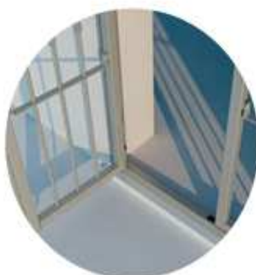
APERTURA PARZIALE ESTERNA